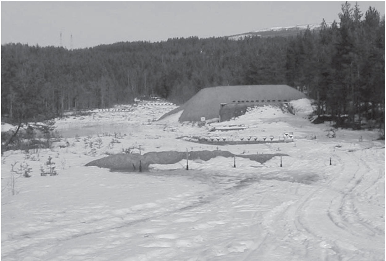
Bolkesjø-banen i "påskevær"

For første gang på svært mange år, skulle vi igjen ha stevne på vinterstid. Som arrangør var vi nok noe usikre på om været skulle holde. Det kunne være alt fra bare snøslaps til 1,5 meter snø om vi var uheldige. Vi så også for oss at det kunne være problem med oppsett av dyra reint tidsmessig.